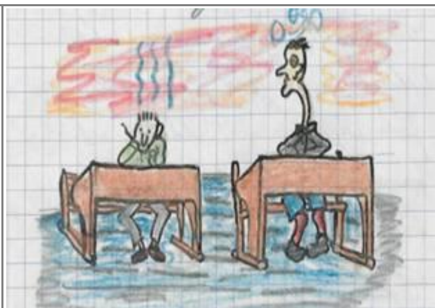
Illustratsiooni salga raamatust 3

Salga koondus on 100%. Üldse on meie poisid kaunis kohusetruud. On see noorusest – või heast tahtmisest, aga loodame, et viimasest. Koondus on /---/ klassis ja ühes I rühma I salgaga. Maalime tahvlile suure liilia. Tanta pragab küll, et mis te kurjad vaimud määrite, aga pole parata, kohustus on kohustus. Joonistuse ajal uuritakse vihke ja nõõre. Kaunis korras? Siis liilia. Asi on kaunis selge. Siis sõlmed. Praavo! Selged!!! Ja nüüd mäng kuulmisele. Teda on juba enne mängitud, aga „kuulajat“ heliliste soovide peale veelkord. Valvel! Koju!