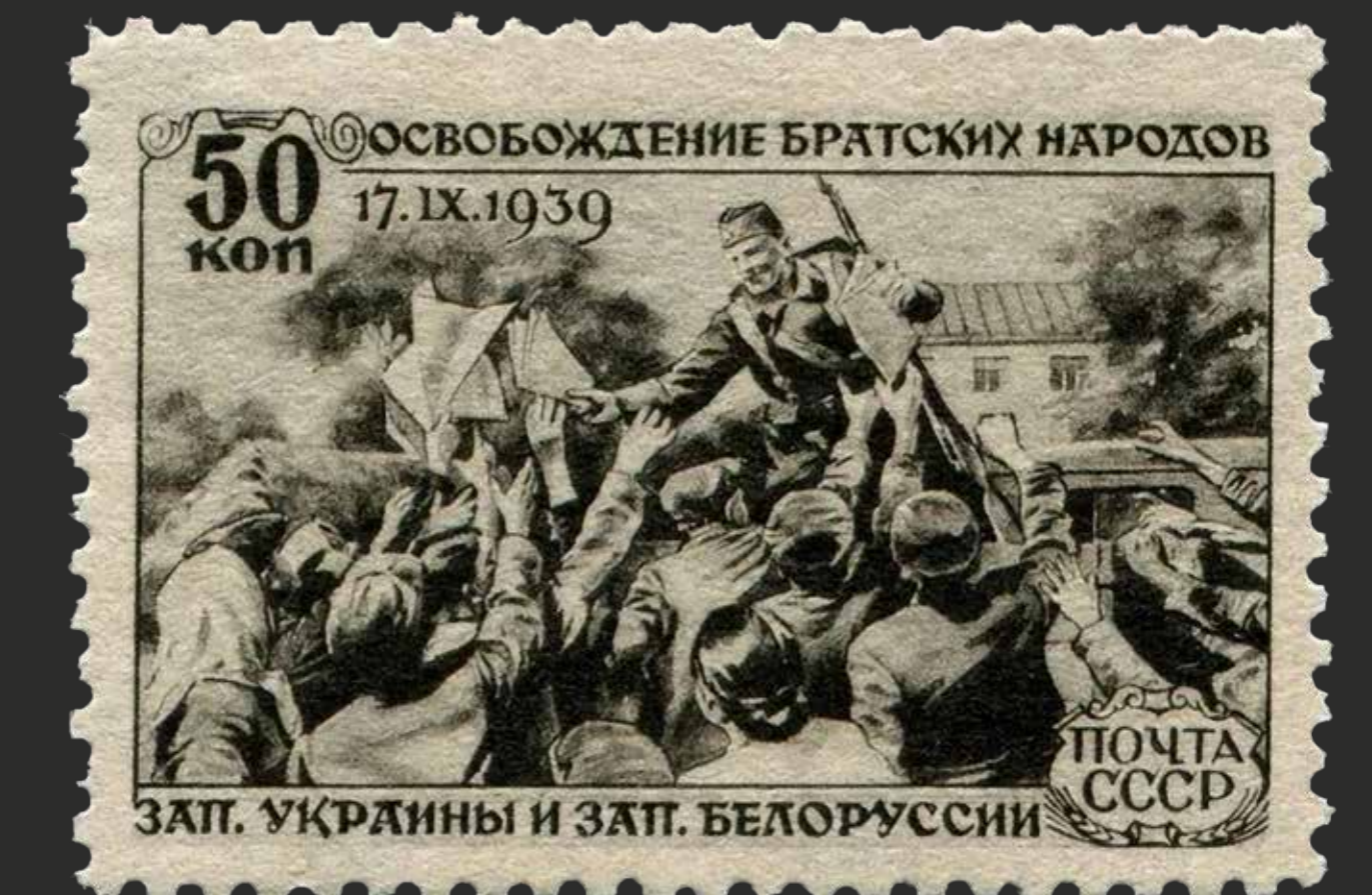
Nõukogude postmark „Vennasrahvaste vabastamine Lääne-Ukrainas ja Lääne-Valgevenes. 17.09.1939“.

Until the summer of 1941, the USSR was an ally of Germany, and raw materials and industrial and agricultural products transported from the USSR to Germany supported Germany's military efforts. Then, in 1941, Germany attacked the Soviet Union, and in 1945, the Soviet Union, allied with Western Europe and the United States, forced Germany to surrender. As a result of the international agreements of 1945, the Soviet Union, which had established its empire in Eastern Europe, as well as its successor Russia, retained the eternal halo of the “saviour of Europe”. The territories annexed or conquered by military force between 1939 and 1940 remained part of the USSR. Although the Western democracies did not recognise the annexation of the Baltic States by the USSR, it failed to hinder USSR's international position, and realpolitik prevailed.