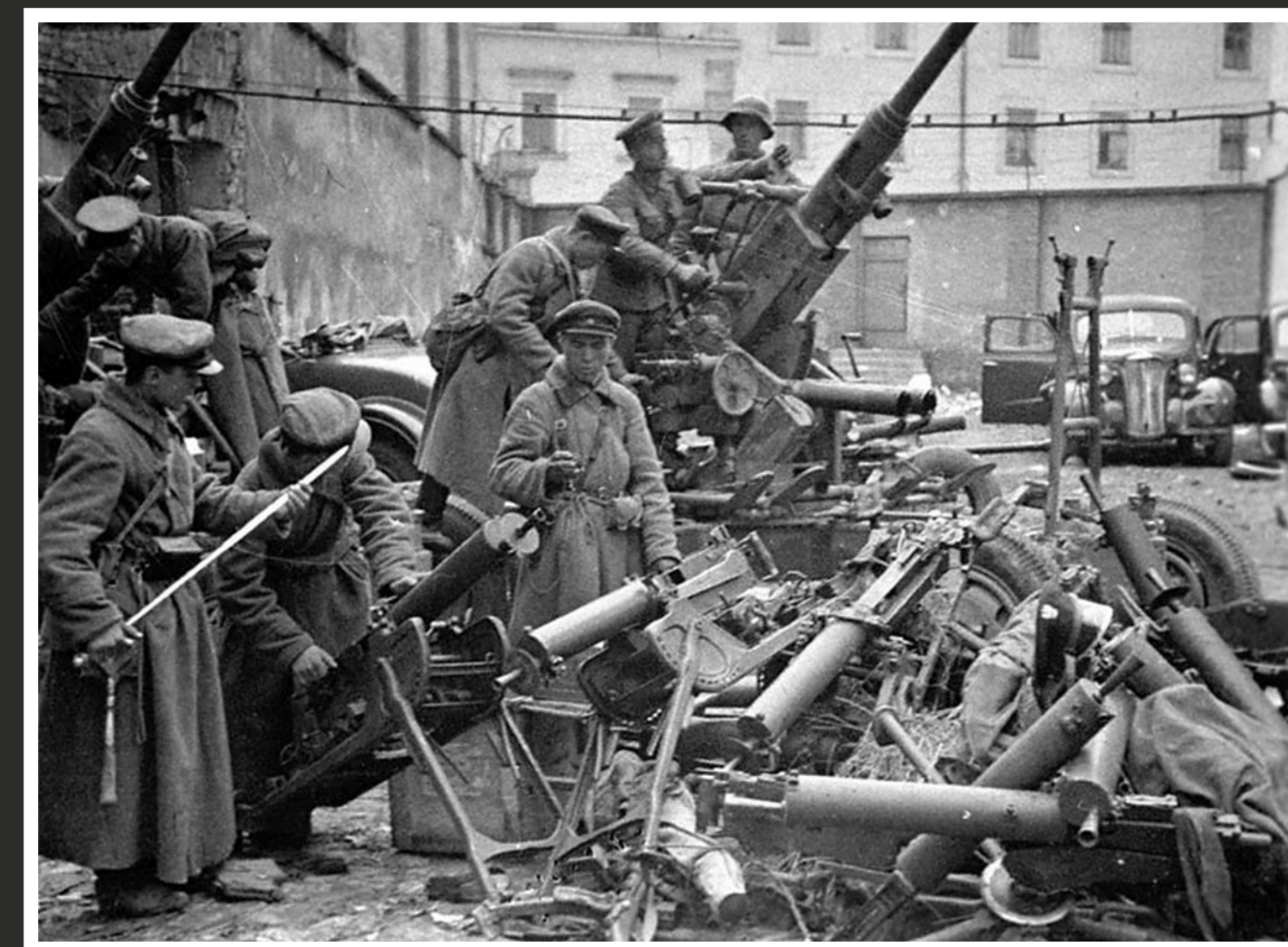
Punaarmeeelased vaatavad Lvivis üle purustatud Poola armeelt sõjasaagiks saadud relvastust.

The city of Wieluń in Poland after the German Air Force's air raid in 1939.