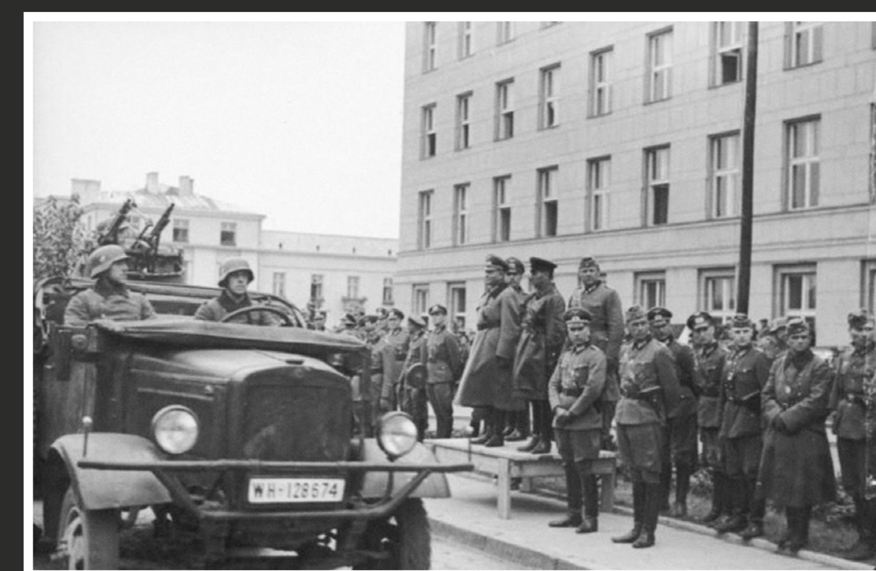
Saksa ja NSV Liidu vägede ühisparaad vallutatud Brest-Litovskis 22.09.1939. a.

Red Army soldiers inspecting weapons taken as spoils from the crushed Polish army in Lviv.