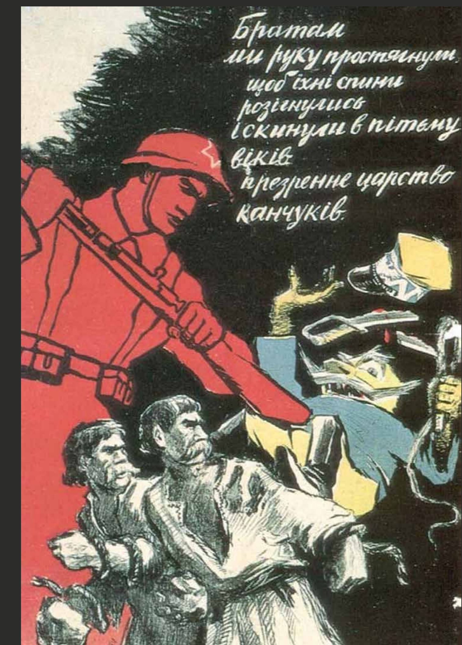
Nõukogude propagandaplakat kujutab Ukraina alade vallutamist sealsete talupoegade vabastamisena nn Poola panide ikke alt.

Soviet postage stamp „The liberation of brotherly nations in Western Ukraine and in Western Belarus. 17.09.1939.”